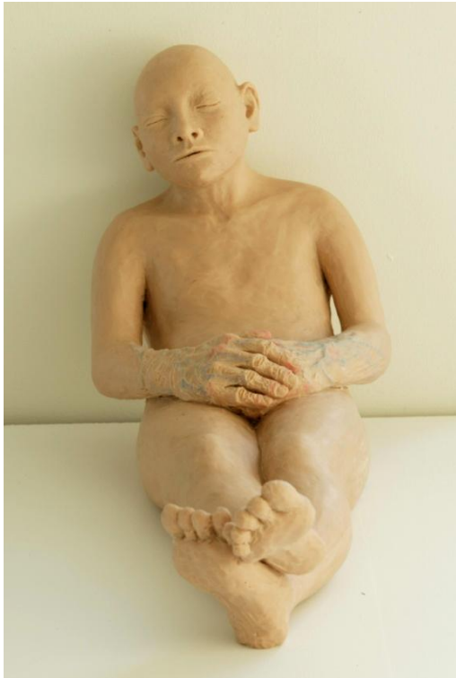
3] Guðrún Vera Hjartardóttir: Hendur . 2004.